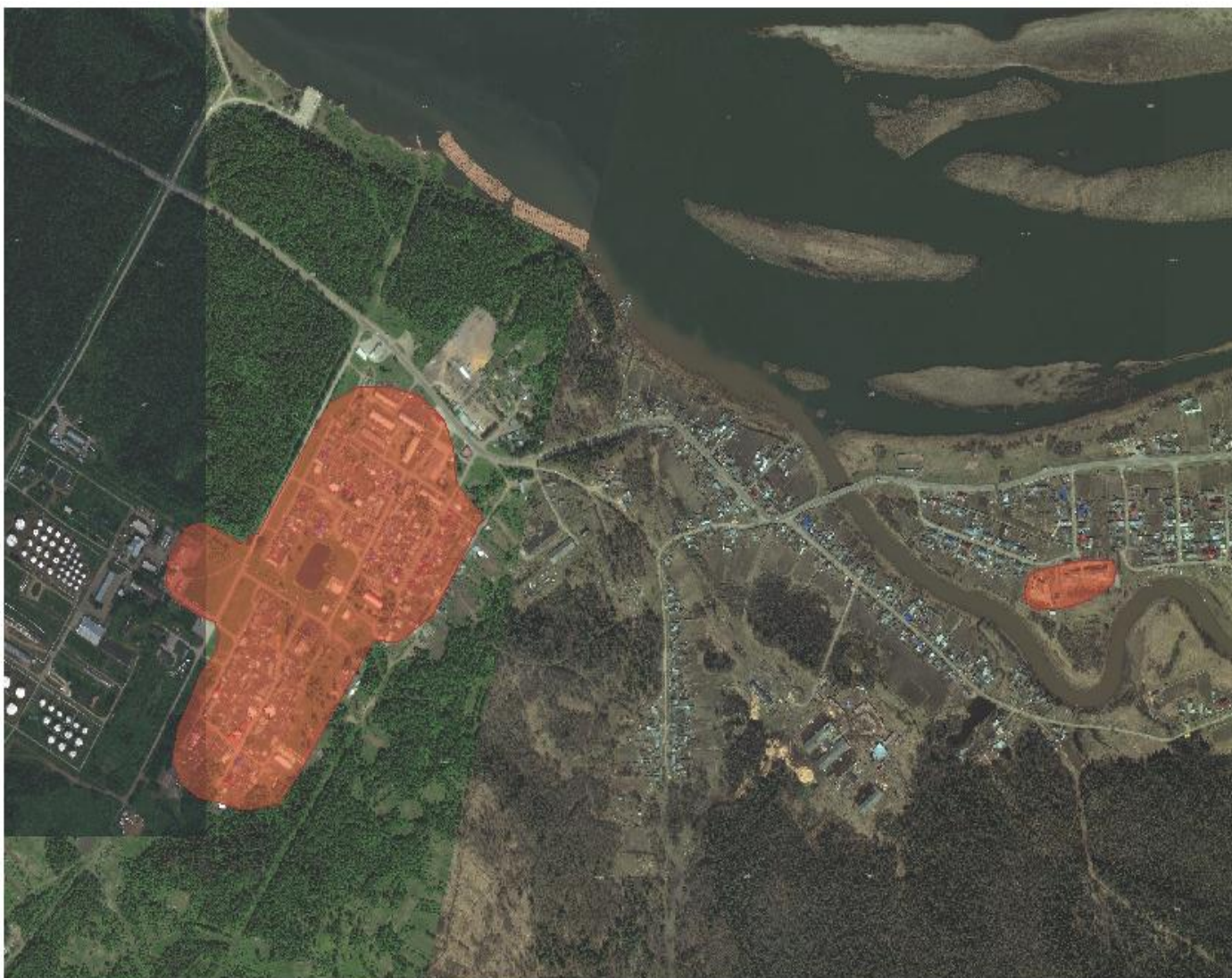
Рисунок 2.1. – Зона действия системы теплоснабжения

Зона действия системы теплоснабжения представлена на рис. 2.1