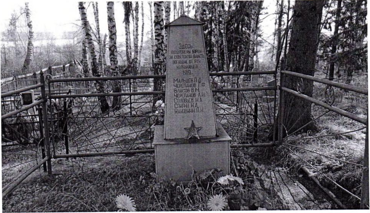
Фото 1.Общий вид памятника