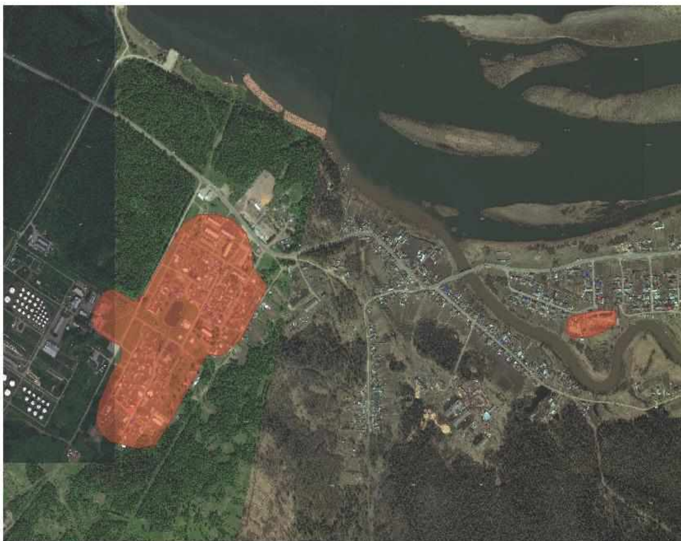
Рисунок 2.1. – Зона действия системы теплоснабжения

Зона действия системы теплоснабжения представлена на рис. 2.1